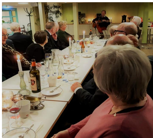
Text och foto Mari-Ann Nilsson i samarbete med Pia Nörling