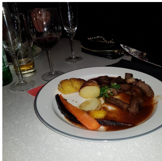
Köttalternativet som var superbt.