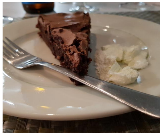
God dessert till kaffet